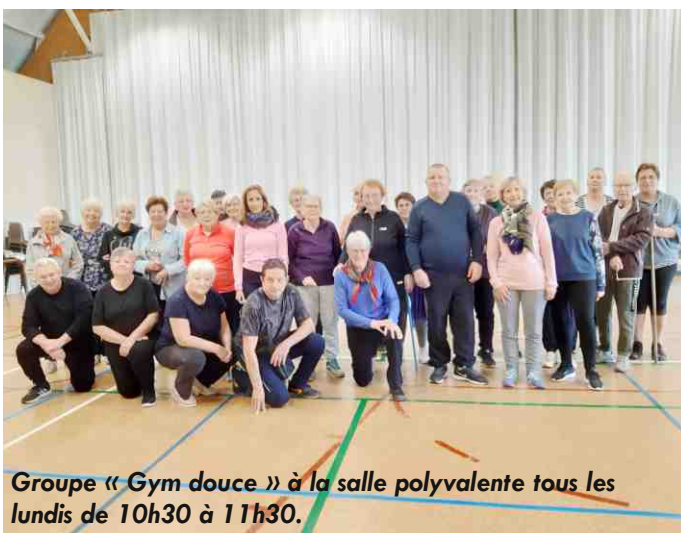
Groupe « Gym douce » à la salle polyvalente tous les lundis de 10h30 à 11h30.

Depuis le mois de novembre, les rencontres du jeudi après-midi se déroulent au foyer-bar de la salle polyvalente.